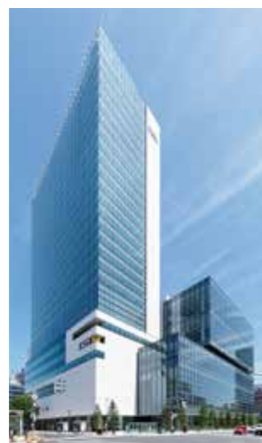
◀ さっぽろ創世スクエア